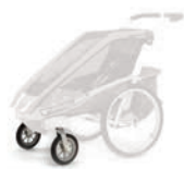
Набор для прогулок Thule

Все коляски Thule спроектированы с учетом нужд конечного потребителя и его стремления к универсальности и надежности. Для этого мы предлагаем вам приобрести дополнительные наборы, которые позволяют заниматься различными видами спорта. Это исключает потребность в покупке нескольких специализированных детских колясок. У местного дилера можно приобрести необходимые дополнительные наборы для конверсии.