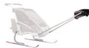
Набор Thule для пеших походов и катания на лыжах

Компания Thule Child Transport Systems Ltd. сохраняет все права на настоящее руководство пользователя. Не разрешается копирование, распространение и несанкционированное использование текста, деталей или иллюстраций из данного руководства в коммерческих целях. Также не разрешается его передача третьим лицам.