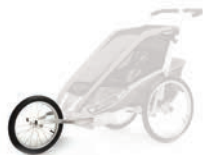
Набор для бега Thule