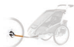
Набор для крепления к велосипеду Thule